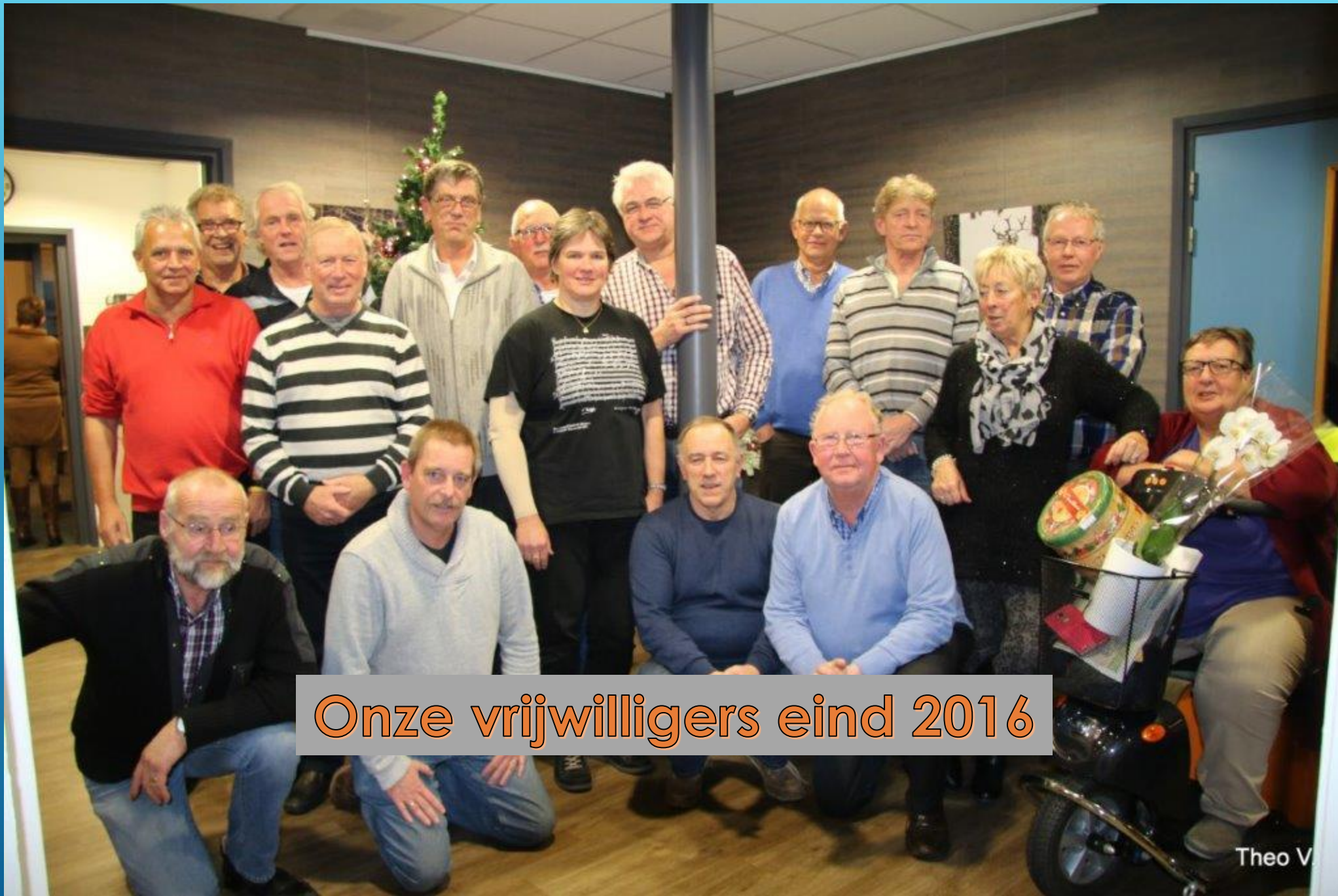
Onze vrijwilligers eind 2016