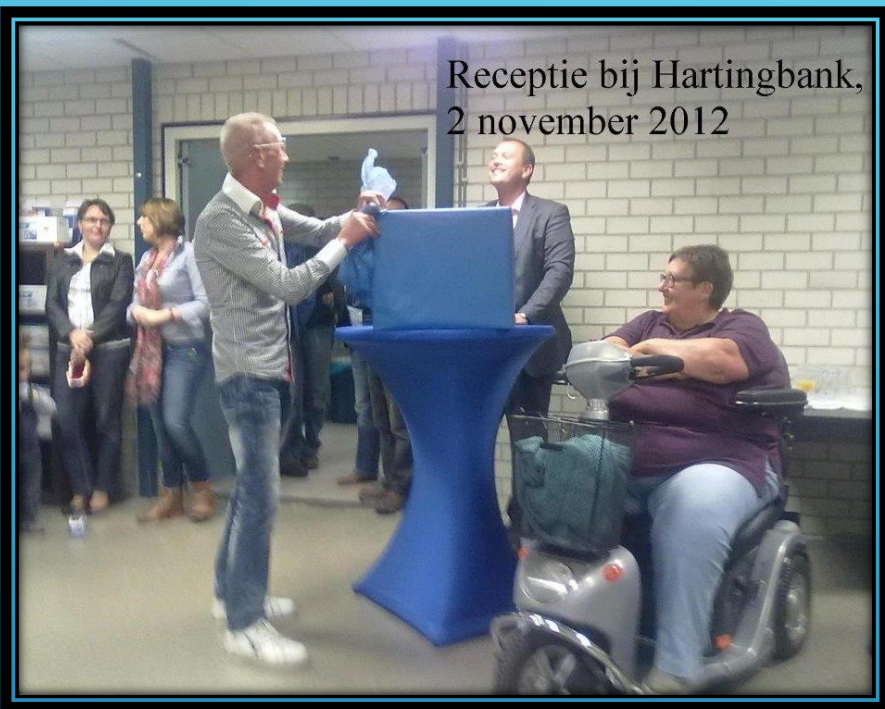
Receptie bij Hartingbank, 2 november 2012