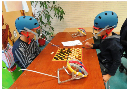
Helmpjes in gebruik. Op voorgrond oud helmpje