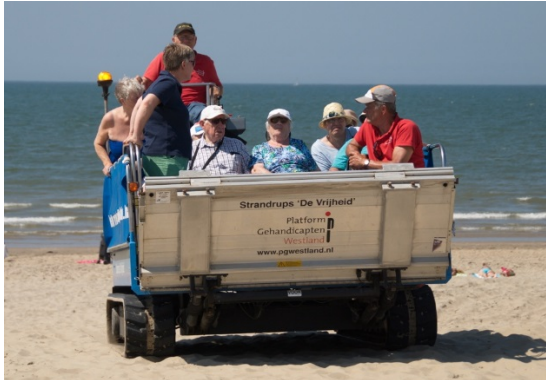
genieten op de strandrups